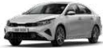
فضي لدمع (4SS)