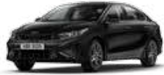
لؤلئي أسود فاتح (ABP)