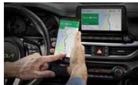
نظام Android Auto