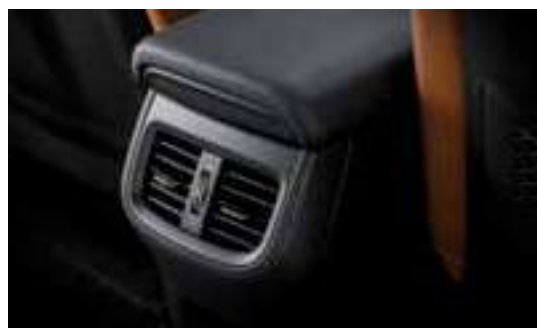
فتحة تهوية للركاب بالخلف

ما المزايا التي تجعل من السيارة سيراتو الاختيار المثالي للقيادة والسفر؟ يمكنك اختيار الميزات الإضافية الملائمة لك، مثل الصوت والرفاهية والتشغيل التلقائي التي تعكس تفضيلاتك، تأكد من أن كل دقيقة تقضيها في السيارة سيراتو هي وقت مميز.