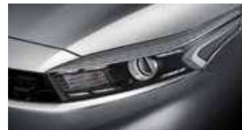
مصابيح أمامية تقليدية مع مصابيح LED للتشغيل النهاري