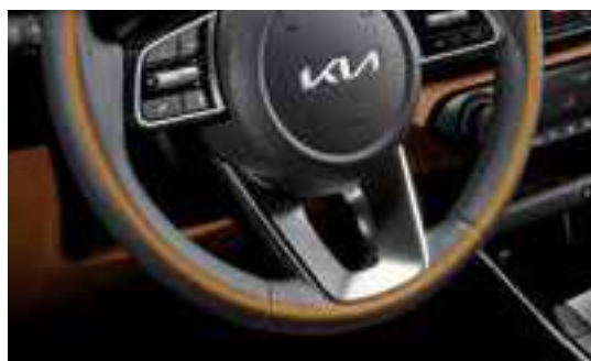
تدفئة عجلة قيادة