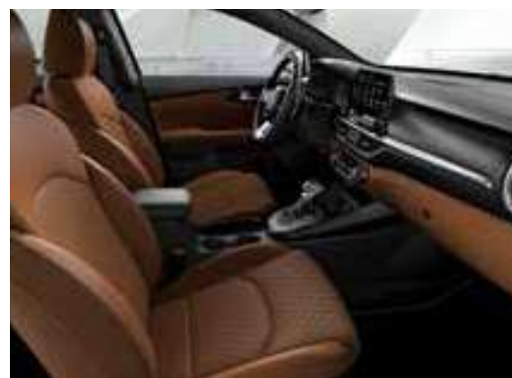
مجموعة اللون البني _جلد بني اللون