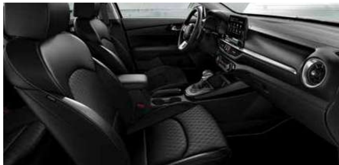
EX _جلد أسود