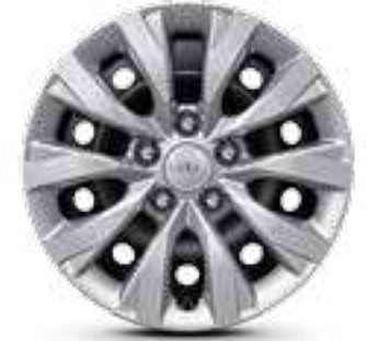
مقاس 16 بوصة R16 55/205 إطارات من الحديد (غطاء العجل)