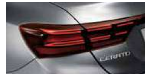
مصابيح LED خلفية