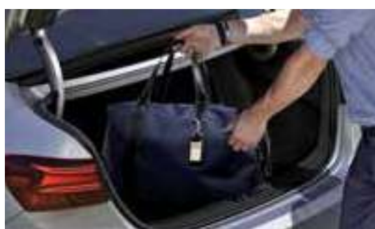
502 لتر سعة الحمولة