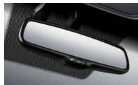
مرآة رؤية خلفية إلكترونية