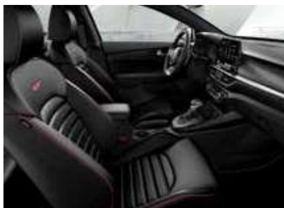
GT _جلد أسود