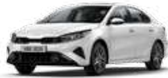
لؤلئي أبيض كالثليج (SWP)