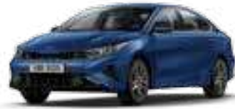
أزرق معدني (M4B)