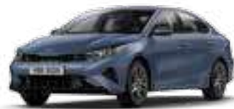
أزرق متوسط (BBL)