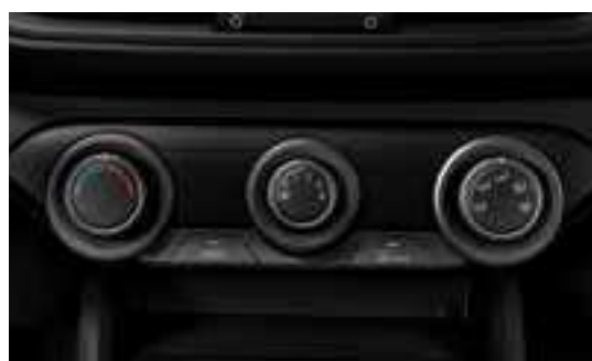
نظام تحكم يدوي لدرجة الحرارة