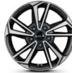
مقاس 16 بوصة R16 55/205 إطارات من الألومنيوم لون رهادي ميتاليك داكن