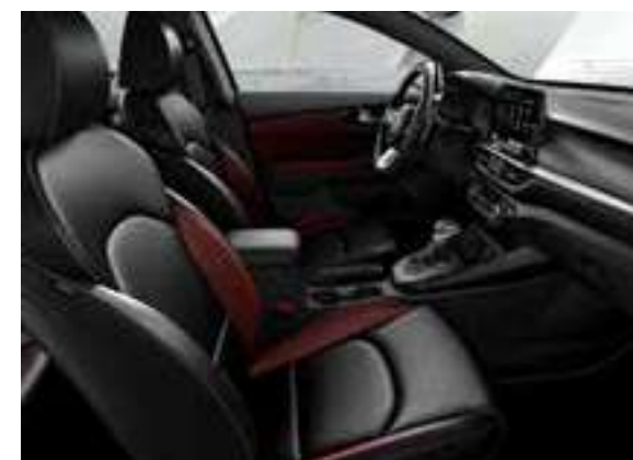
مجموعة اللون الأحمر _جلد أسود وأحمر اللون