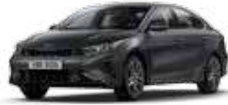
رهادي بلاتينيوم (ABT)