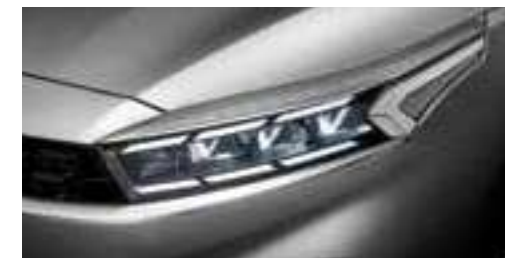
مصابيح LED أمامية كاملة