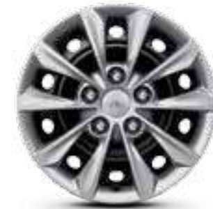
مقاس 15 بوصة R15 65/195 إطارات من الحديد (غطاء العجل)