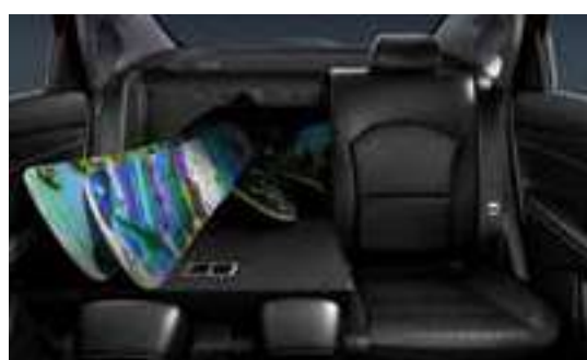
مقاعد قابلة للطي لـ 60:40