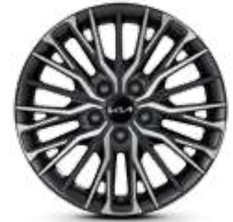
مقاس 17 بوصة R17 45/225 إطارات من الألومنيوم لون رهادي ميتاليك داكن