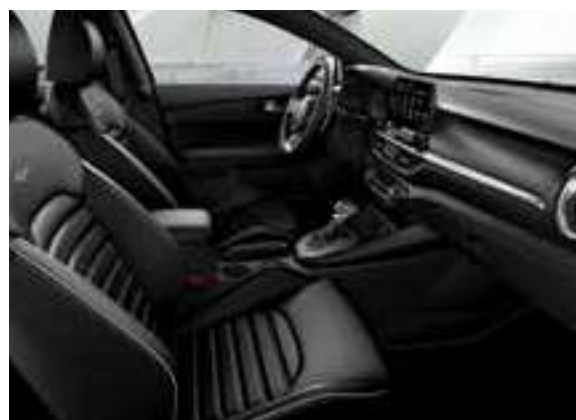
GT-Line _جلد أسود