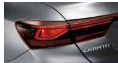
مصابيح تقليدية خلفية