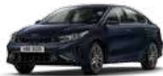
أزرق داكن (B4U)