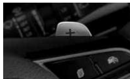
رافعات أذرع تبديل