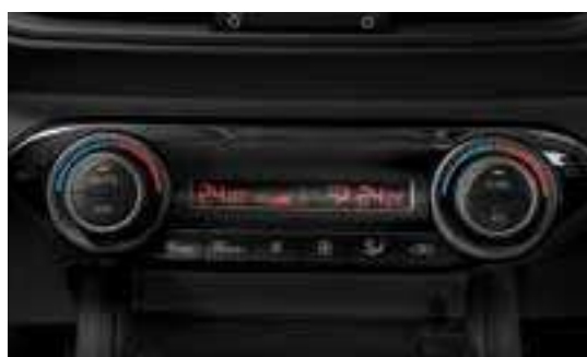
تحكم تلقائي في درجة الحرارة يسمح بنطاقات حرارة مختلفين بالسيارة