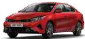
أحمر مُتدرّج اللمعان (CR5)