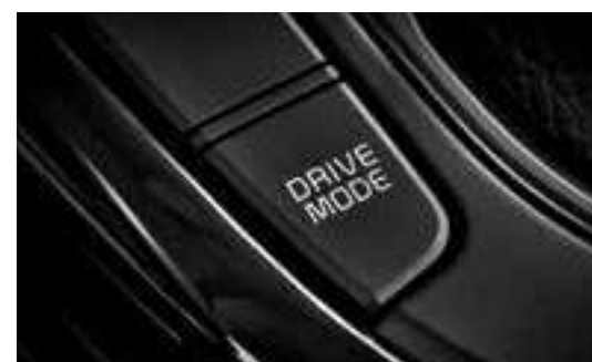
نظام اختيار وضع القيادة (DMS)