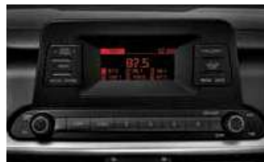
نظام صوت مدمج ذو شاشة عرض قياس 3.8 بوصات