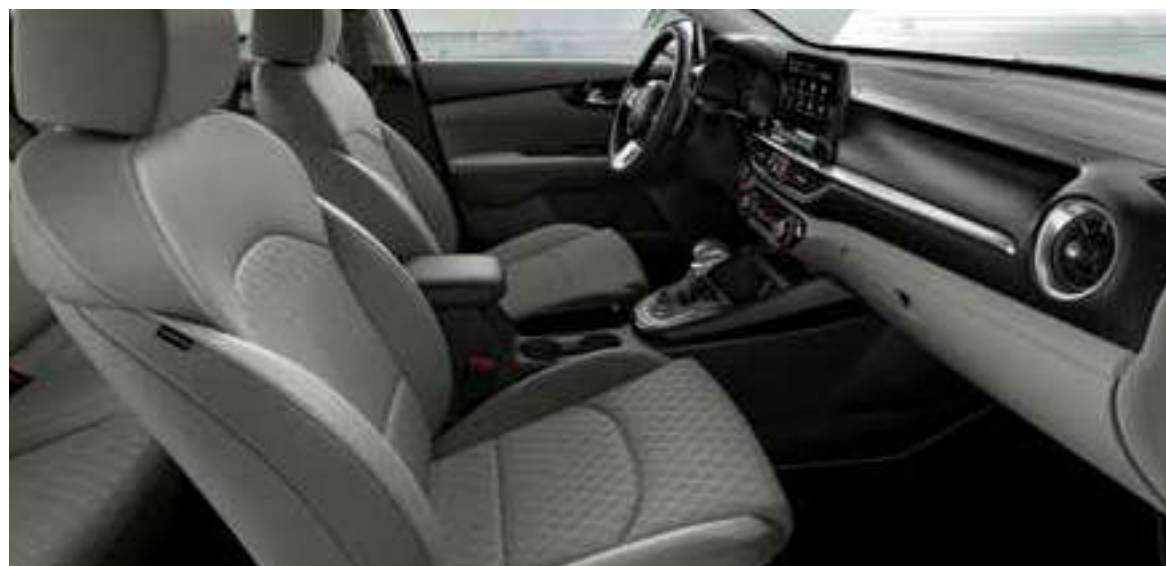
EX _جلد رمادي

اختر ما يلائمك من المقاعد الناعمة والمبنية المتوفرة في مجموعات جذابة من قماش أو قماش وجلد. فكل اختيار طمّم للتوافق مع السمات والتفاصيل الجمالية بالتصميم الداخلي للسيارة سيراتو، مما يمنحك تجربة مريحة وملائمة جداً داخل السيارة.