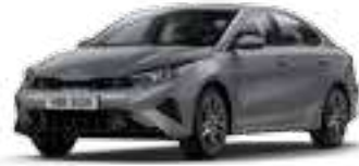
رهادي فولاذي (KLG)