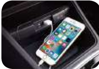
مدخل USB و AUX