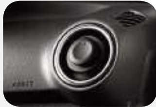
نظام تكييف بوحدات داخل المقصورة قابلة للدوران وتعديل الوجهة بـ 360 درجة