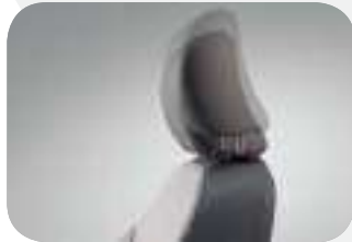
إمكانية ضبط ارتفاع مسند الرأس بكرسي السائق