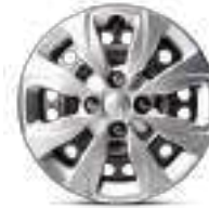
إطارات مقاس 14 بوصة من الحديد