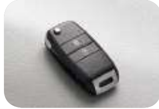
مفتاح السيارة قابل للثني