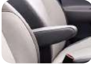
مسند ذراع للسائق