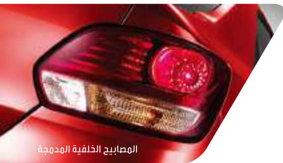
المصابيح الخلفية المدمجة