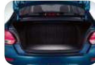
إضاءة عند فتح صندوق السيارة (إضاءة المساحة التخزينية) (L 475)