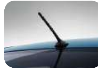
هوائي راديو ثنائي القطب