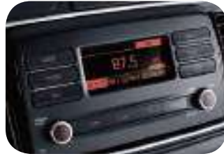
شاشة عرض للراديو بحجم 3.8 بوصة