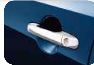
مقايب من مادة الكروم