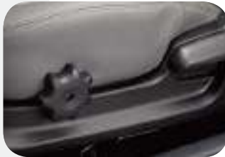
إمكانية ضبط مسند الرأس بكرسي السائق أفقياً