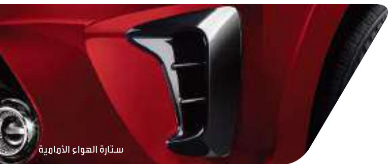
ستارة الهواء الأمامية