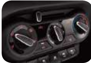
تكييف هواء يدوي