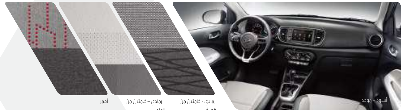
أسود - موحد