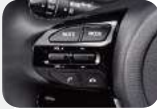
جهاز تحكم للراديو