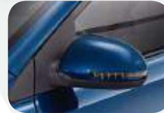
تقنية ضبط المرايا الخارجية إلكترونياً مزودة بإشارات إبضاءة LED