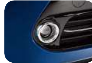
فتحة زجاجية علوية