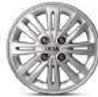
إطارات مقاس 14 بوصة من المعدن