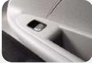
نوافذ خلفية تعمل إلكترونياً